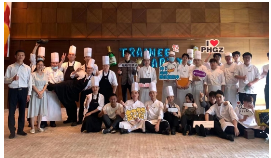
与广州柏悦酒店共同开展人才培养