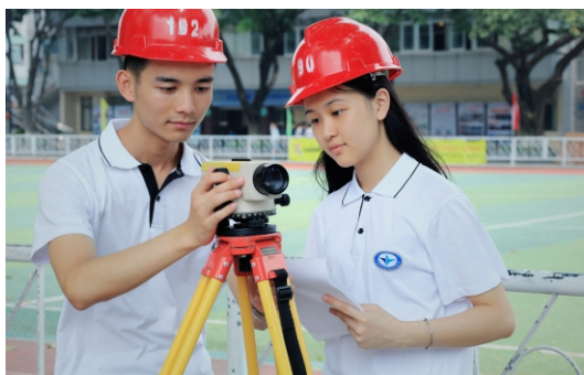
建筑协会实地测量