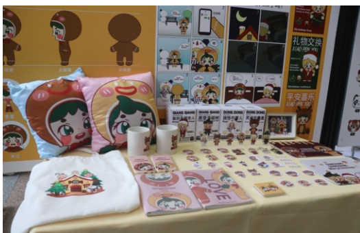
广告协会科技节创作