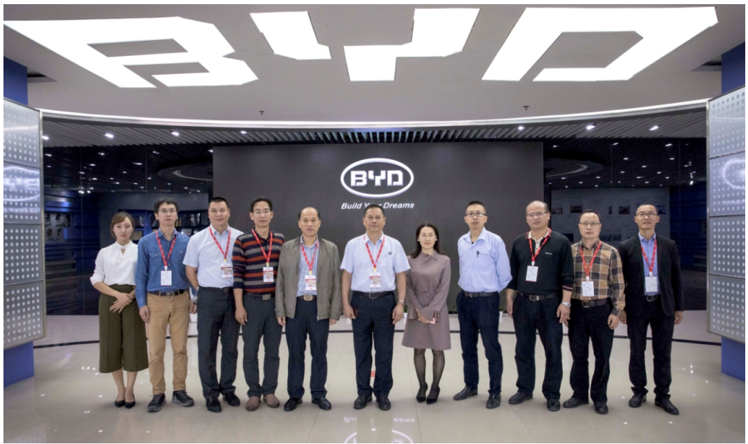
与比亚迪合作共建新能源汽车专业