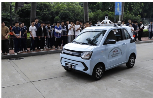
新能源协会无人驾驶汽车测试