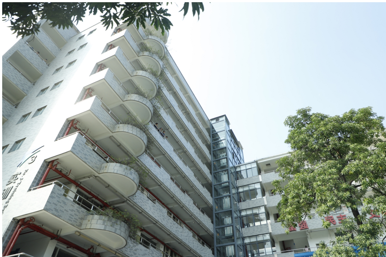
教学楼、宿舍楼换新电梯服务