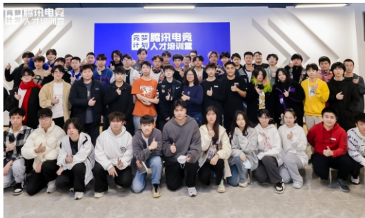
与腾讯电竞合作共同开展人才培养